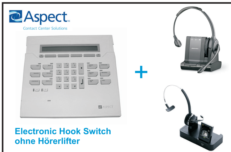
Electronic Hook Switch ohne Hörerlifter

Art und Umfang der Modifizierung richten sich nach dem Telefon-Systemendgerät und der einzusetzenden Headsettechnik.